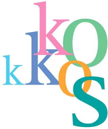
[별첨 5] 엠블럼