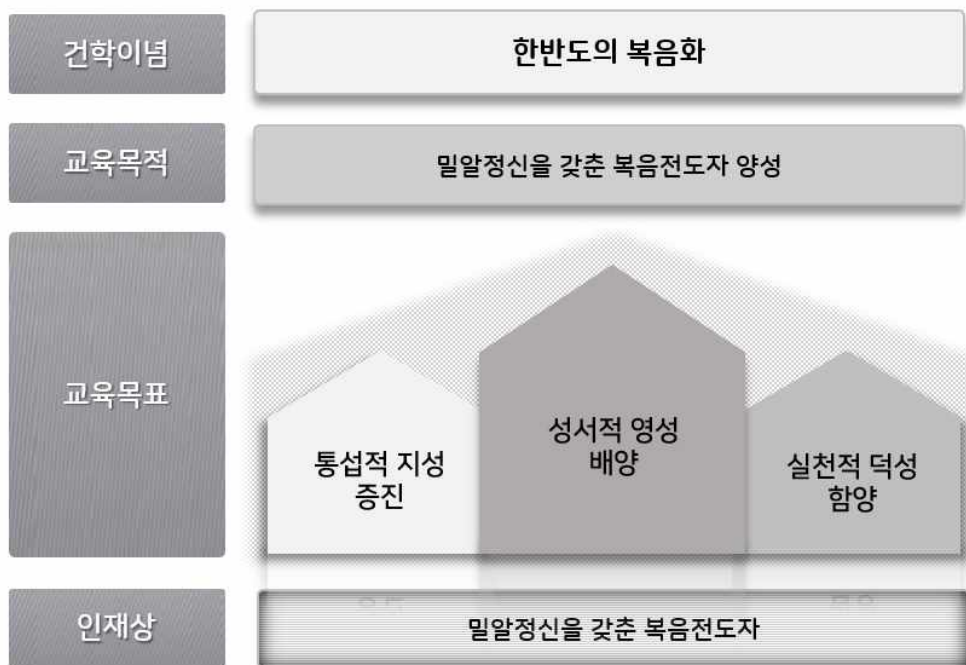
[그림 2-1-1] 한국성서대학교 건학이념-교육목적-교육목표의 체계도